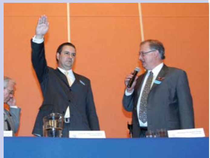
El ganador, Gutiérrez Candiani, protesta como nuevo Presidente Nacional de Coparmex