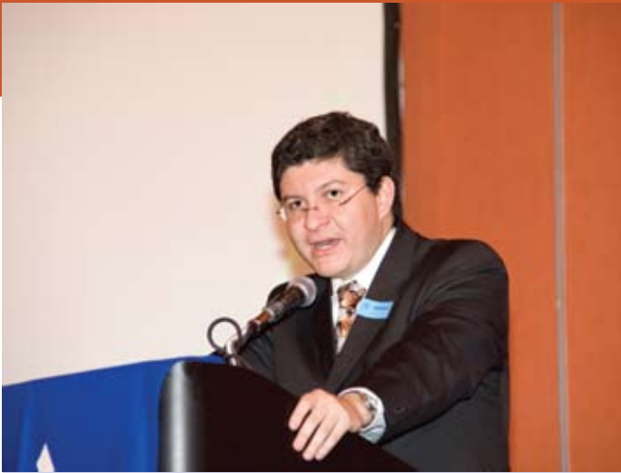
Palabras del Director General de Coparmex Nacional, Ferdinand Recio López