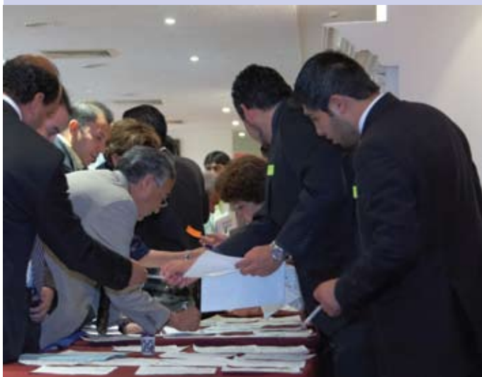
Los asambleístas se registran

En el próximo número de ENTORNO, presentaremos una entrevista con el nuevo Presidente Nacional de la Coparmex.