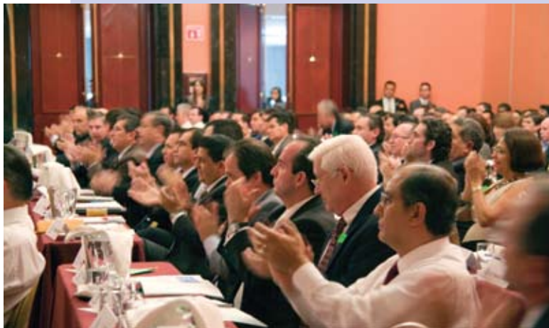
La Asamblea aplaude la gestión del Presidente saliente