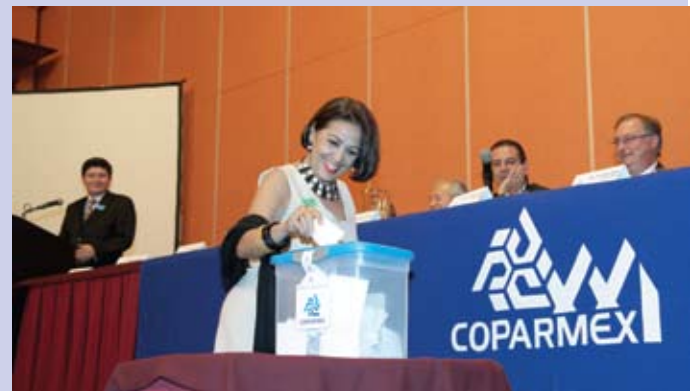
Los asambleístas votan